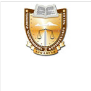
17.09.2013 ՍԵՊՏԵՄԲԵՐ ԱՄՍՎԱ ՎԵՐԱՊԱՏՐԱՍՄԱՆ ԴԱՍԸՆԹԱՑՆԵՐ