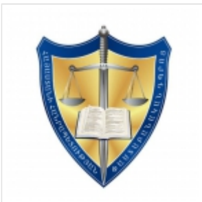
06.11.2013 ԸՆԴՈՒՆԵԼՈՒԹՅՈՒՆ ՀՀ ՓԱՍՏԱԲԱՆԱԿԱՆ ԴՊՐՈՑՈՒՄ

Վերադառնալ $(window).load(function(){ if(typeof $(".fb_comments_count").html() != "undefined" && parseInt($(".fb_comments_count").html()) != 0){ updateCommentsCount(window.location.href); } })