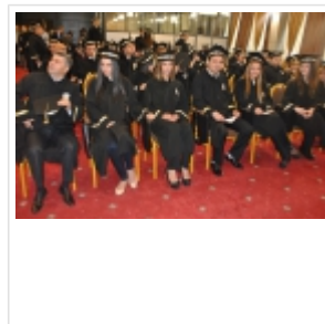
06.10.2013 ՓԱՍՏԱԲԱՆԱԿԱՆ ՀԱՄԱՅՆՔԸ ՀԱՄԱԼՐՎԵՑ ՆՈՐ ՓԱՍՏԱԲԱՆՆԵՐՈՎ