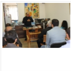
09.10.2013 ԱՎԱՐՏՎԵՑ «ՍՏՐԱՏԵԳԻԱՅԻ ԱՐՎԵՍԸ» ԹԵՄԱՅՈՎ ՎԵՐԱՊԱՏՐԱՍՏՄԱՆ ԴԱՍԸՆԹԱՑԸ