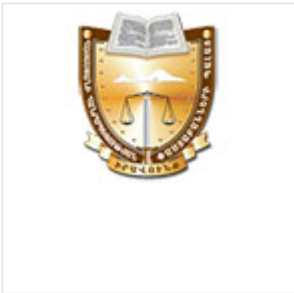
17.09.2013 ՍԵՊՏԵՄԲԵՐ ԱՄՍՎԱ ՎԵՐԱՊԱՏՐԱՍՏՄԱՆ ԴԱՍԸՆԹԱՑՆԵՐ