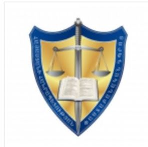
30.09.2013 «ՍՏՐԱՏԵԳԻԱՅԻ ԱՐՎԵՍԸ» ԹԵՄԱՅՈՎ ԴԱՍԱԽՈՍՈՒԹՅՈՒՆ