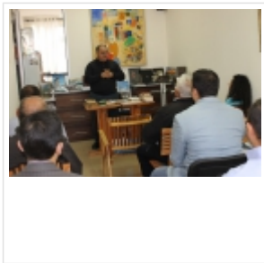
09.10.2013 ԱՎԱՐՏՎԵՑ «ՍՏՐԱՏԵԳԻԱՅԻ ԱՐՎԵՍԸ» ԹԵՄԱՅՈՎ ՎԵՐԱՊԱՏՐԱՍՏՄԱՆ ԴԱՍԸՆԹԱՑԸ