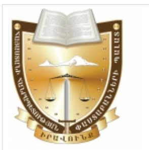
18.10.2013 ՀՀ ՓՊ ՆԱԽԱԳԱՀԻ 17.10.2013Թ