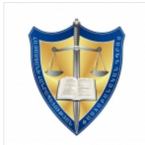
30.09.2013 «ՍՏՐԱՏԵԳԻԱՅԻ ԱՐՎԵՍԸ» ԹԵՄԱՅՈՎ ԴԱՍԱԽՈՍՈՒԹՅՈՒՆ