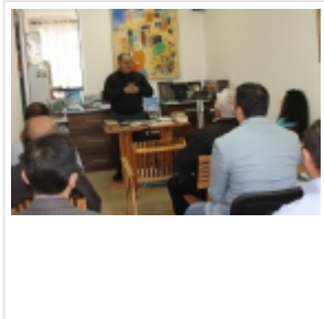
09.10.2013 ԱՎԱՐՏՎԵՑ «ՍՏՐԱՏԵԳԻԱՅԻ ԱՐՎԵՍԸ» ԹԵՄԱՅՈՎ ՎԵՐԱՊԱՏՐԱՍՏՄԱՆ ԴԱՍԸՆԹԱՑԸ