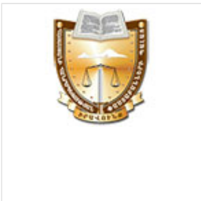
17.09.2013 ՍԵՊՏԵՄԲԵՐ ԱՄՍՎԱ ՎԵՐԱՊԱՏՐԱՍՏՄԱՆ ԴԱՍԸՆԹԱՑՆԵՐ