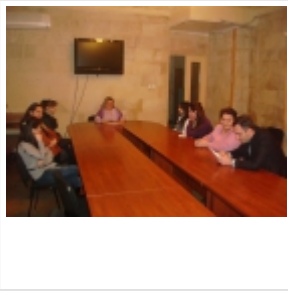
18.12.2013 Տեղի է ՈՒՆԵՑԵԼ ԱԿՈՒՄԲԻ ՆԻՍ