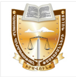
17.09.2013 ՍԵՊՏԵՄԲԵՐ ԱՄՍՎԱ ՎԵՐԱՊԱՏՐԱՍՏԱՆ ԴԱՍԸՆԹԱՑՆԵՐ