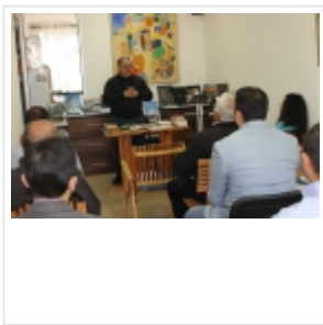
09.10.2013 ԱՎԱՐՏՎԵՑ «ՍՏՐԱՏԵԳԻԱՅԻ ԱՐՎԵՍԸ» ԹԵՄԱՅՈՎ ՎԵՐԱՊԱՏՐԱՍՏԱՆ ԴԱՍԸՆԹԱՑԸ