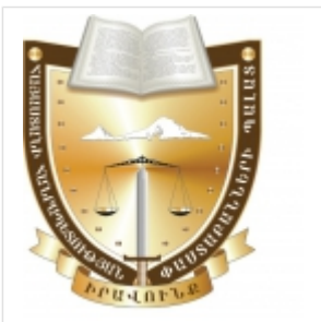
27.11.2013 ՓԱՍՏԱԲԱՆՆԵՐԻ ՊԱԼԱՏԸ ՔԱՂԱՔԱՑԻՆԵՐԻՆ ԻՐԱՎԱԲԱՆԱԿԱՆ ԽՈՐՀՐԴԱՏՎՈՒԹՅՈՒՆ