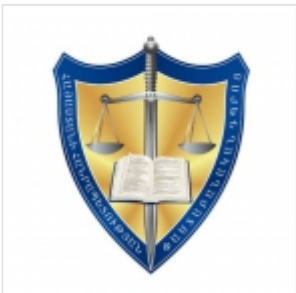
30.09.2013 ԴԱՍԸՆԹԱՑՆԵՐԻ ՓՈՓՈԽՈՒԹՅՈՒՆ