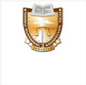
17.09.2013 ՍԵՊՏԵՄԲԵՐ ԱՄՍՎԱ ՎԵՐԱՊԱՏՐԱՍՏՄԱՆ ԴԱՍԸՆԹԱՑՆԵՐ