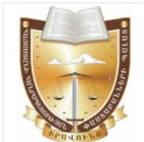
09.09.2016 ՍՅՈՒՆԻՔԻ ՄԱՐԶԻ ՓԱՍՏԱՔԱՆՆԵՐԻ