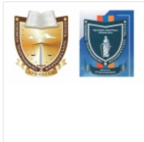
17.11.2016 ՀԱՆՐԱՅԻՆ ՊԱՇՏՊԱՆԻ ԹԱՓՈՒՐ ՏԵՂԵՐԻ ՀԱՄԱԼՐՄԱՆ ՆՊԱՏԱԿՈՎ 2016 ԹՎԱԿԱՆԻ ՆՈՅԵՄԲԵՐԻՆ ԿԱՆՑԿԱՑՎԻ ՄՐՑՈՒՅԹ