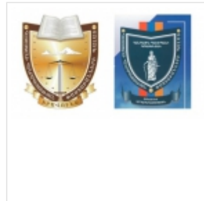
08.12.2016 ԱՄՓՈՓՎԵԼ ԵՆ ՀԱՆՐԱՅԻՆ ՊԱՇՏՊԱՆԻ ԱՇԽԱՏԱՆՔԻ ԱՆՑՆԵԼՈՒ ՀԱՄԱՐ ԱՆՑԿԱՑՎԱԾ ՄՐՑՈՒՅԹՆԵՐԻ ԳՐԱՎՈՐ ՓՈՒԼԻ ԱՐԴՅՈՒՆՔՆԵՐԸ