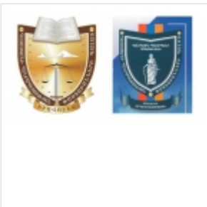
09.12.2016 ՄՐՑՈՒԹԱՅԻՆ ՀԱՆՁՆԱԺՈՂՈՎԻ ԱՐՁԱՆԱԳՐՈՒԹՅՈՒՆԸ՝ ՀԱՆՐԱՅԻՆ ՊԱՇՏՊԱՆԻ ԱՇԽԱՏԱՆՔԻ ԱՆՑՆԵԼՈՒ ՀԱՄԱՐ ԱՆՑԿԱՑՎԱԾ ՄՐՑՈՒՅԹՆԵՐԻ ԳՐԱՎՈՐ