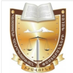
09.09.2016 ՍՅՈՒՆԻՔԻ ՄԱՐԶԻ ՓԱՍՏԱԲԱՆՆԵՐԻ ՑՈՒՑԱԿ՝ ՍՅՈՒՆԻՔԻ ՄԱՐԶՈՒՄ ՄԱՐԶԱՅԻՆ ՀԱՄԱԿԱՐԳՈՂԻ 2016 ԹՎԱԿԱՆԻ ՍԵՊՏԵՄԲԵՐԻ 17-Ի ԸՆՏՐՈՒԹՅԱՆ ԿԱՊԱԿՑՈՒԹՅԱՄԲ