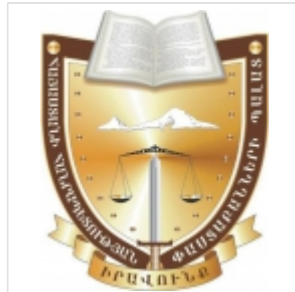
15.09.2016 ՍՅՈՒՆԻՔԻ ՄԱՐԶՈՒՄ ՄԱՐԶԱՅԻՆ ՀԱՄԱԿԱՐԳՈՂԻ 2016 ԹՎԱԿԱՆԻ ՍԵՊՏԵՄԲԵՐԻ 17-Ի ԸՆՏՐՈՒԹՅԱՆ ՔՎԵԱԹԵՐԹԻԿՆԵՐԻ ՏՊԱԳՐՈՒԹՅԱՆ ՕՐՎԱ, ԺԱՄԻ ԵՎ ՎԱՅՐԻ ՄԱՍԻՆ