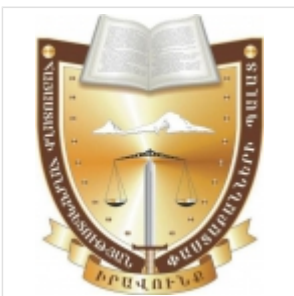
16.09.2016 ԼՈՒՈՒ ԵՎ ՏԱՎՈՒՇԻ ՄԱՐԶԵՐՈՒՄ ՄԱՐԶԱՅԻՆ