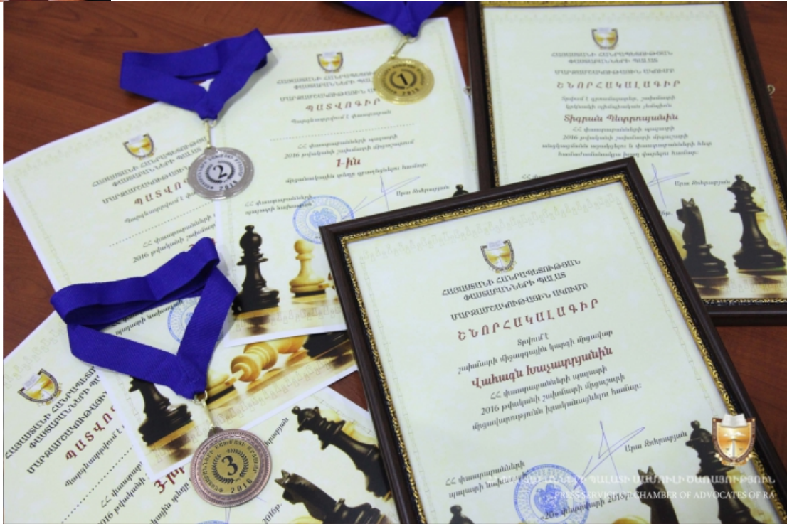
ՀՀ ՓՈՒՍԿԱՆՆԵՐԻ ՊԱՍՏԻ ՄԱՍԻՆԻ ՕՍՈՒՅՈՒԹՅՈՒՆ PRESS SERVICE OF CHAMBER OF ADVOCATES OF RA