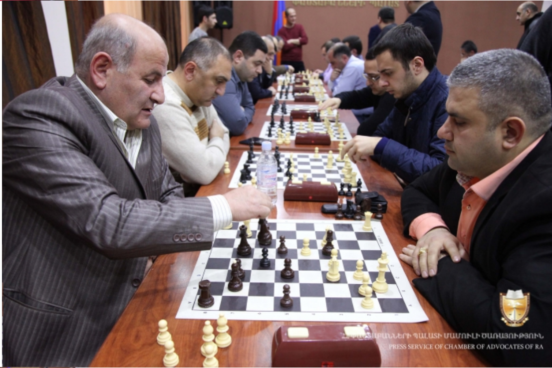
ՀՀ ՓՈՒՍԿԱՆՆԵՐԻ ՊԱՍՏԻ ՄԱՍԻՆԻ ՕՍՈՒՅՈՒԹՅՈՒՆ PRESS SERVICE OF CHAMBER OF ADVOCATES OF RA