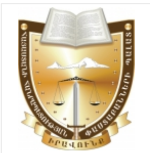
23.10.2013 «ՓԱՍՏԱԲԱՆԻ ՕՐ»