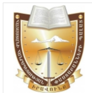
01.07.2016 ԱՐԱՐԱՏԻ, ԱՐՄԱՎԻՐԻ, ԿՈՏԱՅՔԻ ԵՎ