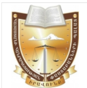
07.07.2016 ԱՐԱՐԱՏԻ, ԱՐՄԱՎԻՐԻ, ԿՈՏԱՅՔԻ ԵՎ