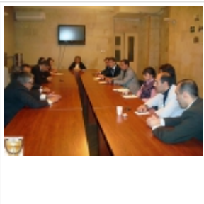
22.11.2013 ՓԱՍՏԱԲԱՆՆԵՐԻ ՊԱԼԱՏԻ ԱԿՈՒՄԲՈՒՄ ՔՆՆԱՐԿՎԵԼ Է ՓԱՍՏԱԲԱՆԱԿԱՆ ԳՈՐԾՈՒՆԵՈՒԹՅԱՆ ԻՐԱԿԱՆԱՑՄԱՆ ԱՌԱՆՁՆԱՀԱՏԿՈՒԹՅՈՒՆՆԵՐԸ