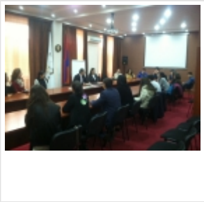
30.10.2015 ԱՆԱՆԻԱ ՇԻՐԱԿԱՑԻ ՎԱՐԺԱՐԱՆԻ ԱՇԱԿԵՐՏՆԵՐԸ ՀՅՈՒՐԸՆԿԱԼՎԵԼ ԵՆ ՓԱՍՏԱԲԱՆՆԵՐԻ ՊԱԼԱՏՈՒՄ

Վերադառնալ $(window).load(function(){ if(typeof $(".fb_comments_count").html() != "undefined" && parseInt($(".fb_comments_count").html()) != 0){ updateCommentsCount(window.location.href); } })