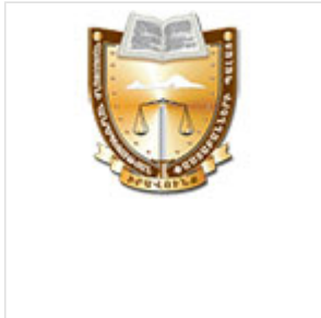
21.07.2017 ՀՀ ՓԱՍՏԱԲԱՆՆԵՐԻ ՊԱԼԱՏԻ ԽՈՐՀՈՒՐԴԸ ՓԱՍՏԱԲԱՆՆԵՐԻ ԻՐԱՎՈՒՆՔՆԵՐԻ ՊԱՇՏՊԱՆՈՒԹՅԱՆ ՀԱՐՑԻ ՎԵՐԱԲԵՐՅԱԼ ԿԱՅԱՅՐԵԼ Է ՈՐՈՇՈՒՄ